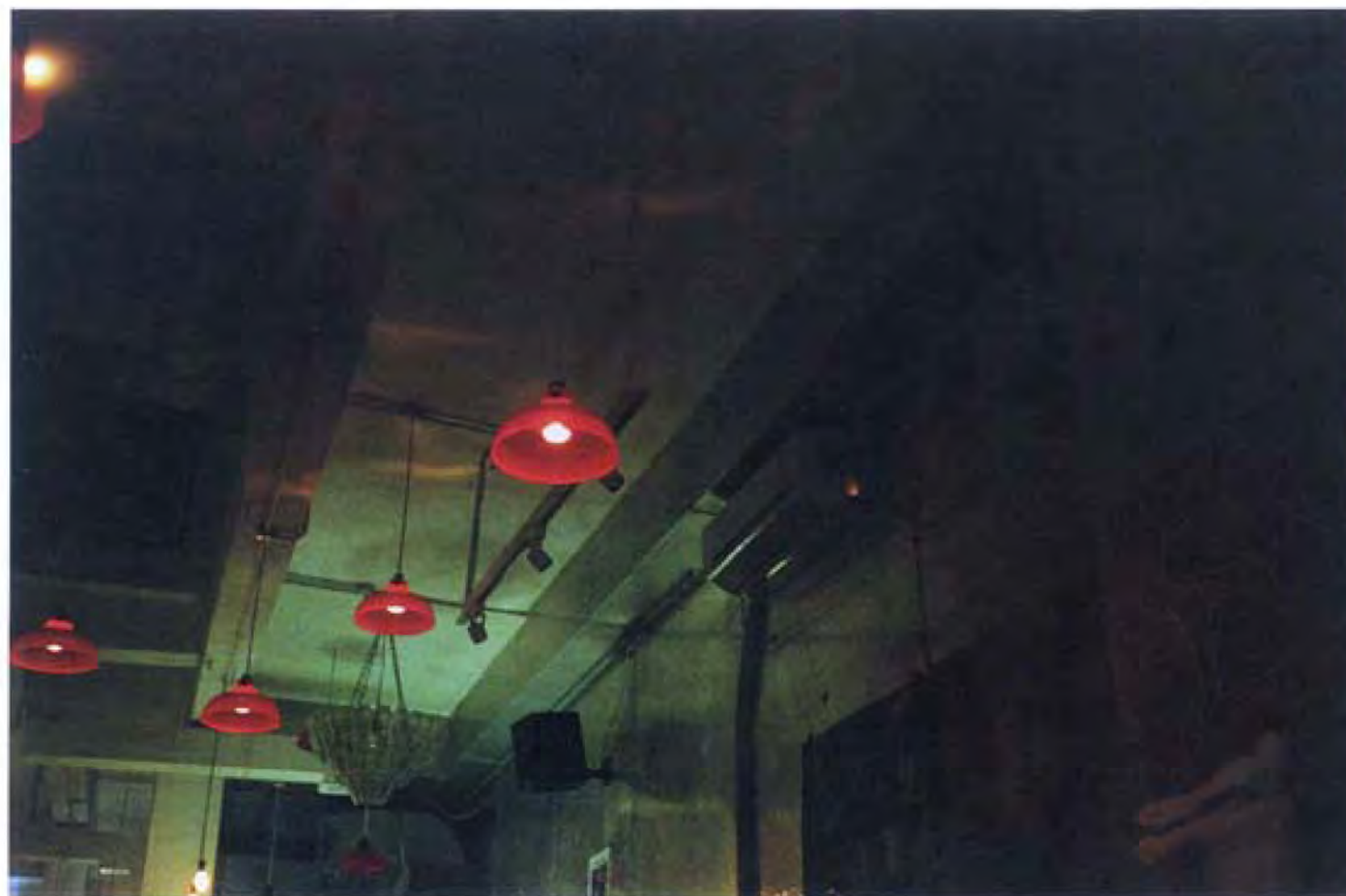
▲ (鏡面照片) 左思右想(六十五) · 2006 · 彩色相片 · 鏡片 · 50 x 150厘米 · 香港文化博物館