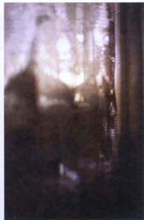
▲ 家 · 意大利安波租 · 2006 · 彩色相片