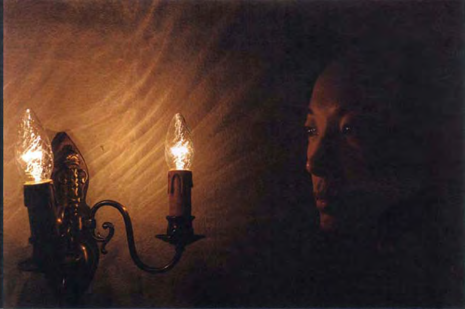
▲ (真真照片) 左思右想(十六) · 2006 · 彩色相片 · 底片 · 50 x 150 厘米 · 香港文化博物館