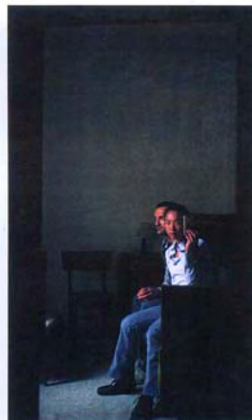
▲ Two in One · 意大利阿西西 · 2005 · 彩色相片