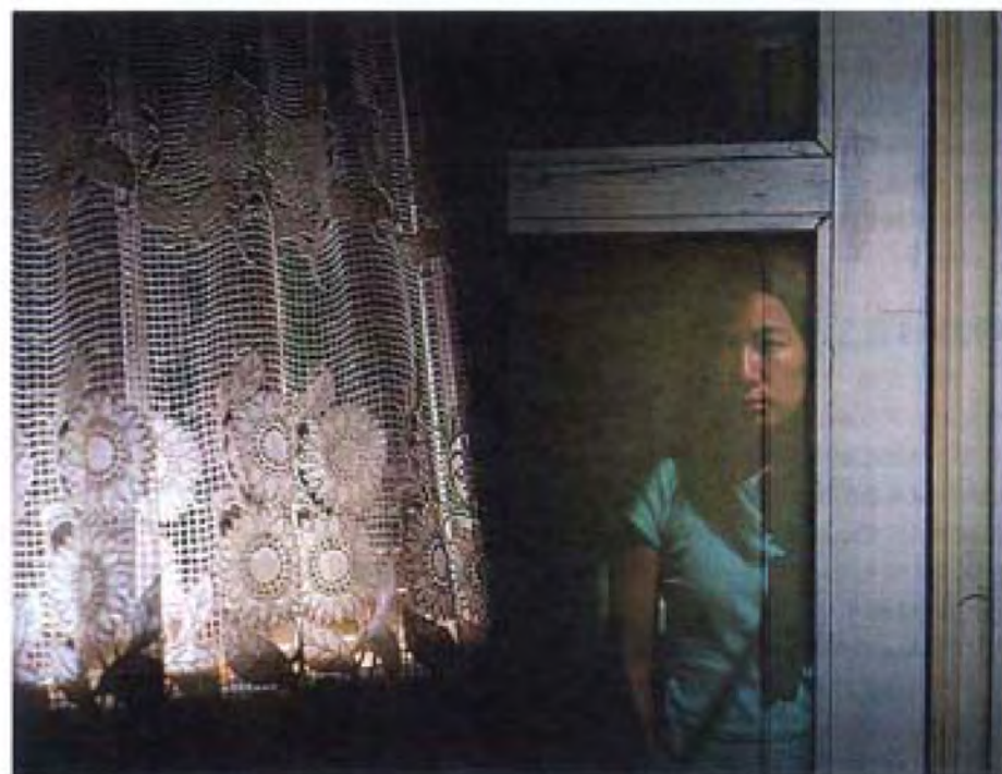
▲ 左思右想 (二十二) · 2006 · 彩色相片 · 紙片 · 75 x 100 厘米 · 香港文化博物館