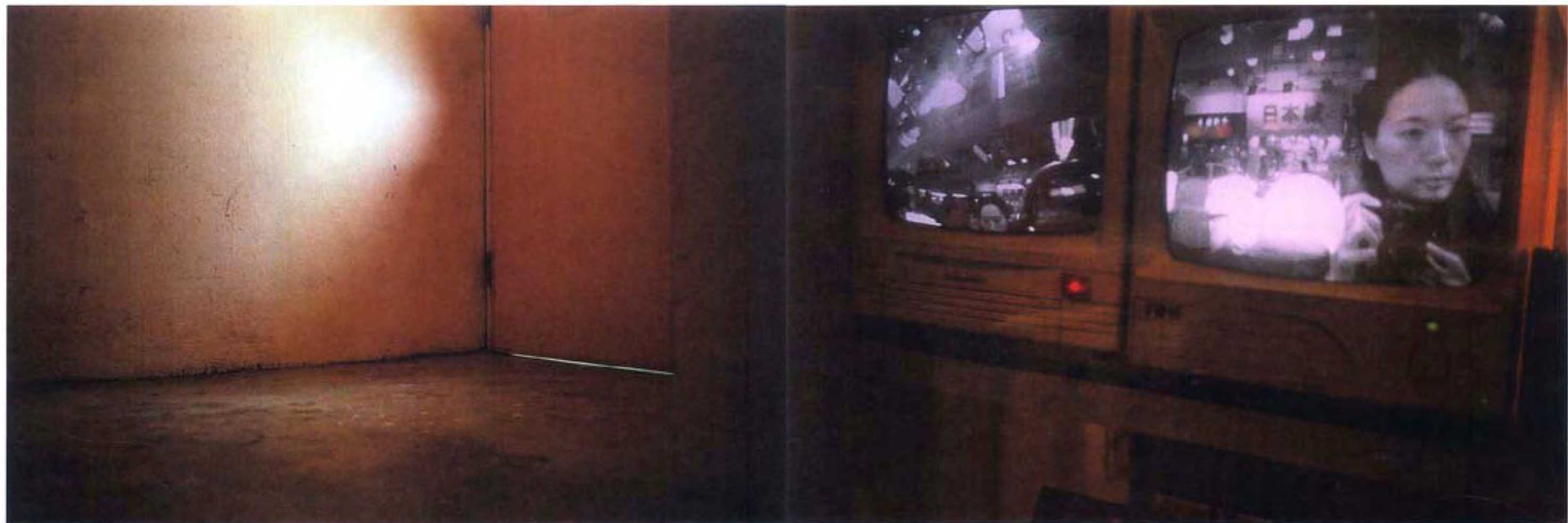
▲ (鏡面照片) 左思右想 (四十七) · 2006 · 彩色相片 · 紙片 · 50 x 150 厘米 · 香港文化博物館