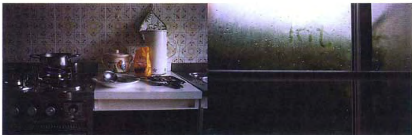
▲ 左思右想 (三十一) · 2006 · 彩色相片 · 銀片 · 50 x 150 厘米 · 香港文化博物館