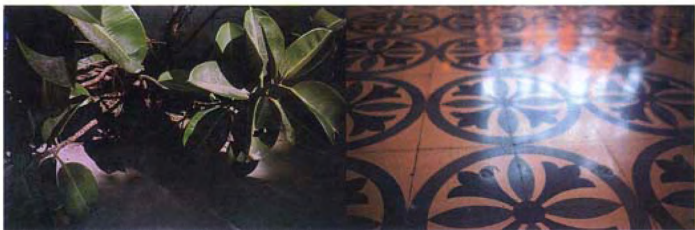
▲ 左思右想 (十三) · 2006 · 彩色相片 · 銀片 · 50 x 150 厘米 · Vitamin Arte Contemporanea