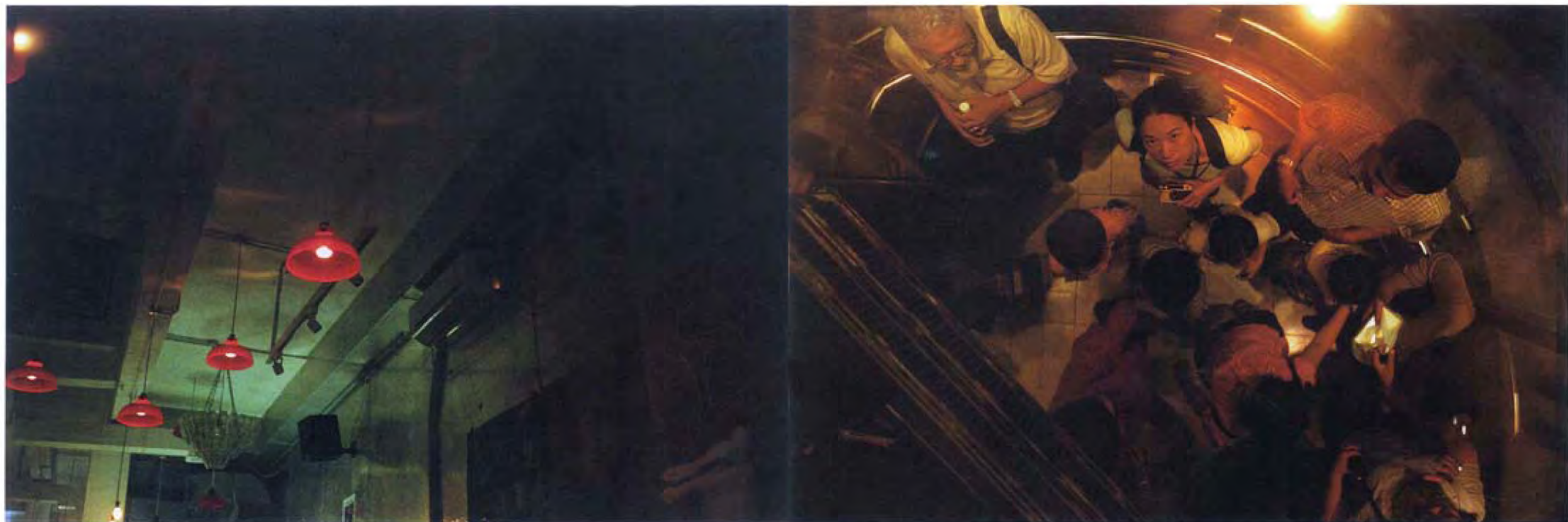
▲《鏡面照片》左思右想(六十五)·2006·彩色相片·銀片·50 x 150厘米·香港文化博物館

純只想拍下自己的樣子，而是想透過攝影這個方式，去揭開究竟自己是誰這個謎團。她指這是很多藝術家都有的興趣。現在，她不單對尋找自己身分感到興趣，更有興趣把這個身分展示於別人面前，和如何去表達。「我覺得最令自己感興趣的是看一個人拍攝另一個人，當中被攝者會盡量將自己最好的一面展示出來。」林認為這是一個很有趣的過程，如何去將這個身分向社會表達，加上自己女性的身分，也是很有意思的。作品依從探索自己的方向而來，林指照片中自己的鏡像甚至不是自己，她認為照片有留傳於世的作用，裏面的影像正是受著社會影響而衍生的意識形態。