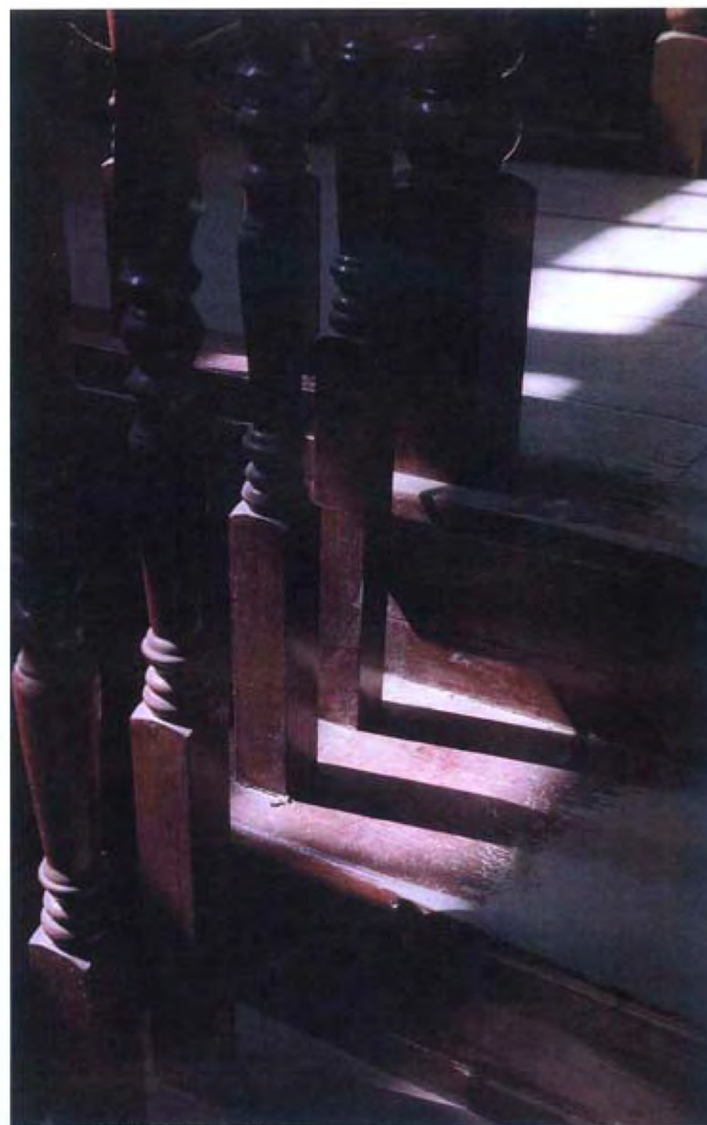
▲ 老房子 · 中國廣州 · 2005 · 彩色相片